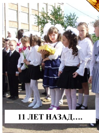
11 ЛЕТ НАЗАД....